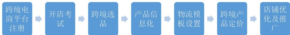
图 2 跨境电商平台运营流程图